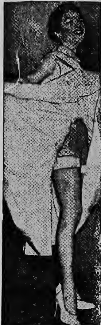
This three-piece beach ensemble, with a sleeveless blouse and a red and white striped yoke to match, was a feature of one of the top Paris fashion shows...